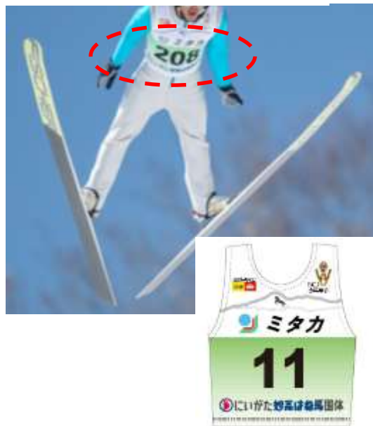
にいがた妙高はね馬国体のゼッケン広告