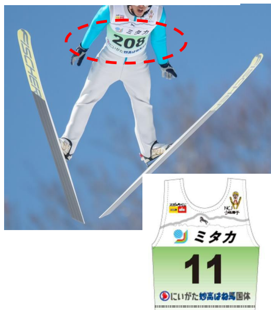
にいがた妙高はね馬国体のゼッケン広告